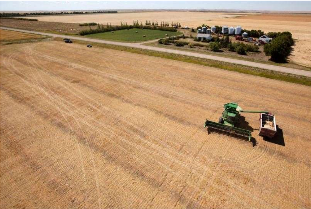
DOK1. Ein Bauernhof in Montana